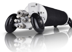
Packer d'installation DN 150-200

Chaque système Quick-Lock nécessite son kit d'installation. Les manchons Quick-Lock sont installés à l'aide d'un outil d'installation spécialement conçu.