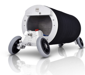
Packer d'installation DN 350-500