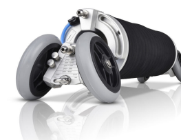
Packer d'installation DN 200-300